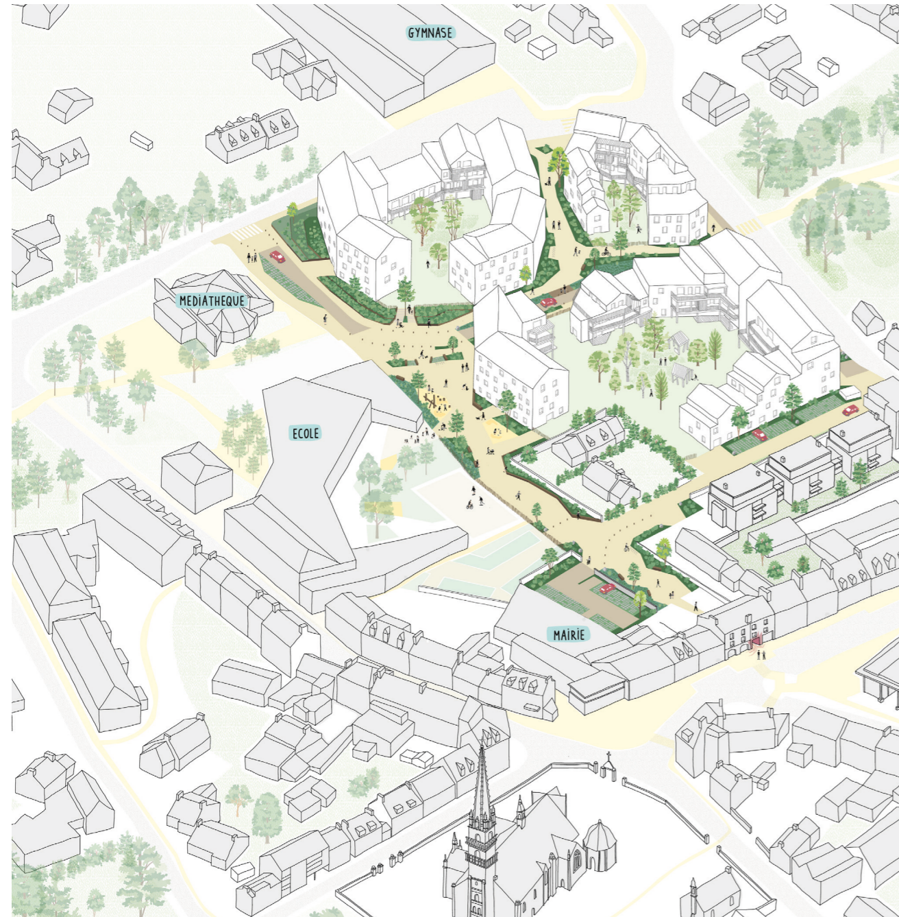
Vue du projet urbain