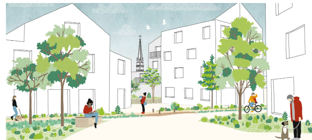
Vue sur le clocher de l'Eglise depuis la venelle piétonne