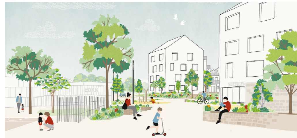
Vue de la placette piétonne de coeur de quartier

La mise en lien des espaces publics avec ceux déjà présents tout en améliorant le rapport des équipements à la ville est traité dans l'aménagement proposé. L'écologie a une place importante au sein du projet, ainsi, les espaces naturels majeurs du centre-ville entre les boisements à l'Est et la vallée Saint-Gouesnou sont prolongés à l'intérieur du projet urbain.