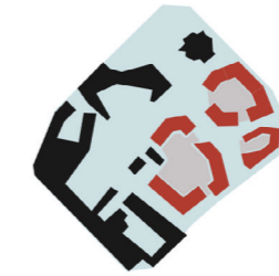
Synthèse des principes fondateurs du projet

Ainsi, il a été imaginé un traitement différent sur les deux façades de chaque bâtiment avec des façades externes, en lien direct avec l'espace public et des façades internes, donnant sur un espace privé intime de coeur d'îlot végétalisé.